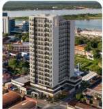
ZUBA CENTRO Oliva esq. Hermandarias